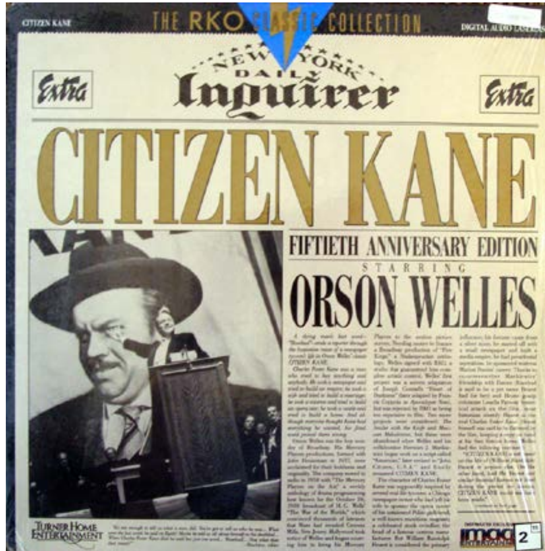
Fig. 1. Citizen Kane (1941) Le film est à la fois une manifestation des aspirations des cinéastes à l'autonomie et une réflexion sur l'hétéronomie d'une presse qui est exposée à l'emprise des milieux d'affaires.